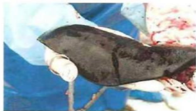
Збільшена в декілька разів селезінка свині при АЧС