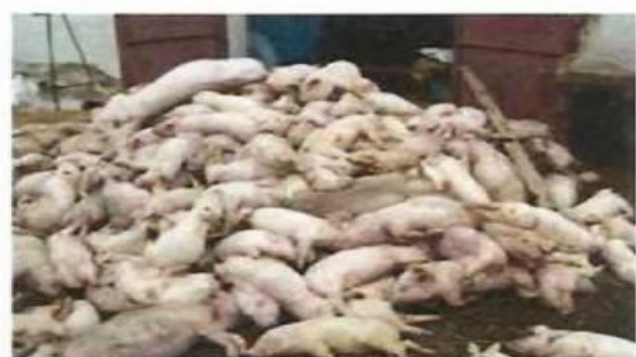
Загибель великої кількості свиней