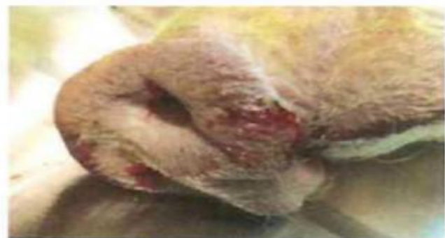
Почервоніння п'ятачка свині