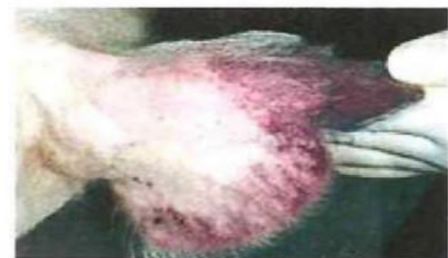
Почервоніння кінчиків вух